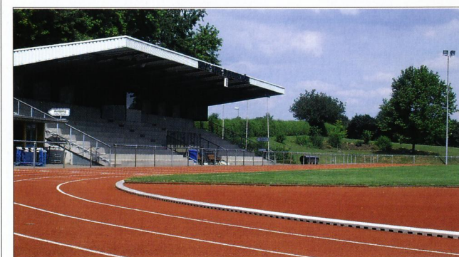
Vereins- und Sportförderung hat im Main-Kinzig-Kreis hohe Priorität.